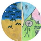
Groep 5 + 6: Van Gogh of Miró