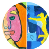
Groep 7 + 8: Picasso of Matisse