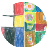
Groep 1 + 2: Mondriaan of Kandinsky