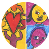
Groep 3 + 4: Haring of Warhol